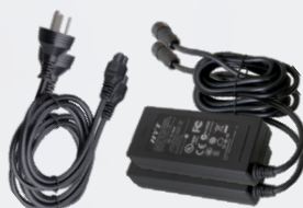
Блок питания для переносного ретранслятора PS7502