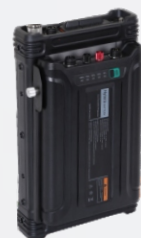
Система управления питанием PV3001