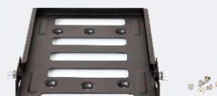
Многофункциональный монтажный кронштейн BRK17

Настоятельно рекомендуем воспользоваться антенной, разработанной компанией Hytera. *При эксплуатации RD965 с антенной вне помещений следует избегать попадания в грозу.