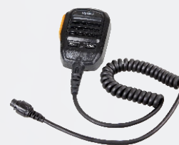
Водонепроницаемый выносной микрофон- динамик (IP67) SM18A1.

Настоятельно рекомендуем воспользоваться антенной, разработанной компанией Hytera. *При эксплуатации RD965 с антенной вне помещений следует избегать попадания в грозу.