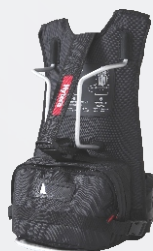
Нейлоновый рюкзак (только для переносного ретранслятора) (черный) NCN010